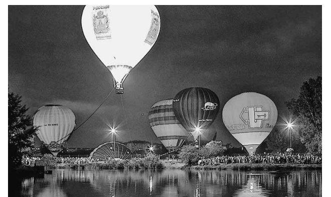
На снимке: воздушные шары в вечернем небе над озером в Ессентуках.

На Курортном бульваре состоялся аукцион талантов «Капелька России», на котором выступали солисты и танцевальные коллективы города. Вечером для жителей и гостей курорта на городском озере было показано зрелищное представление – свечение воздушных шаров, которые освещали берег и водную гладь фантастическими красками. Затем команды пяти воздушных шаров показали умение подняться в воздух с небольшой площадки – шары парили в небе, публика была в восторге, а потом все аэростаты медленно отнесло воздушным течением в район Белого Угля, пригорода Ессентуков. Там они и приземлились.