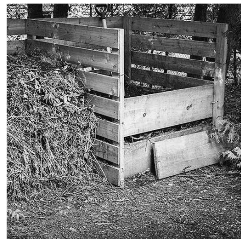
ПОЛОСУ ПОДГОТОВИЛА ИРИНА ПАВЛОВА

4. В готовом компосте нет червей. Пока компост зреет, образуется большое количество тепла, которое в совокупности со свободным доступом к пропитанию привлекает множество червей, играющих, кстати, важную роль в создании этого органического удобрения. После того как компост хорошо перепреет, червей в компосте не остаётся, поскольку там больше нет неразложившихся растительных остатков, а значит, и нет для них пропитания. Отсутствие червей – верный признак готовности компоста. Смело берите его и несите на свои грядки.